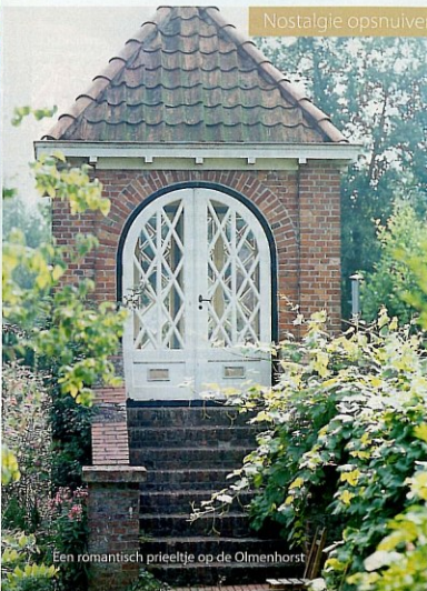
Een romantisch prieeltje op de Olmenhorst