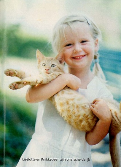
Liselotte en Knikkebeen zijn onafscheidelijk