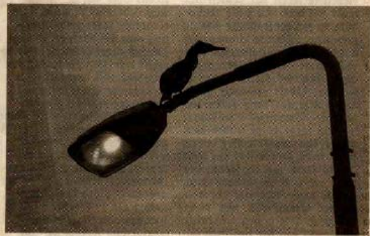
Een aalscholver op zijn hoge uitkijkpost.