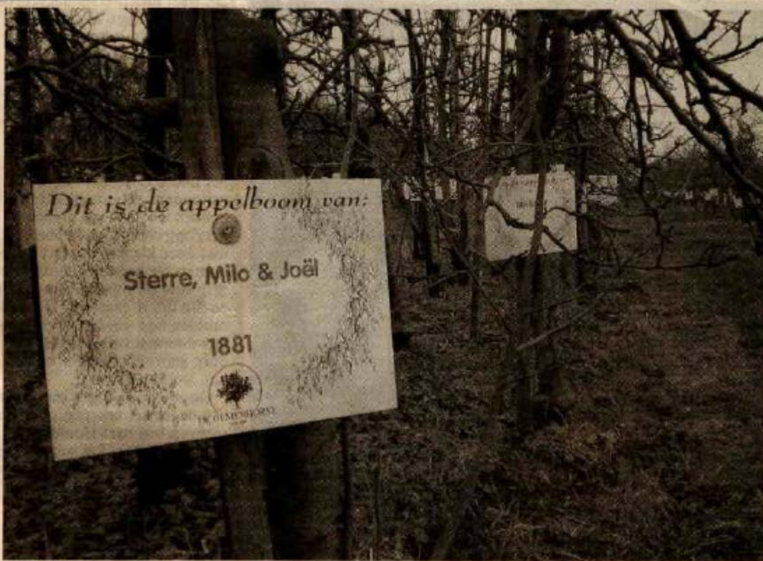
Adoptiebomen op De Olmenhorst. Er staan er inmiddels een dikke drieduizend.

Het bordje vertelt dat we de Lisserbroekerweg moeten aflo-