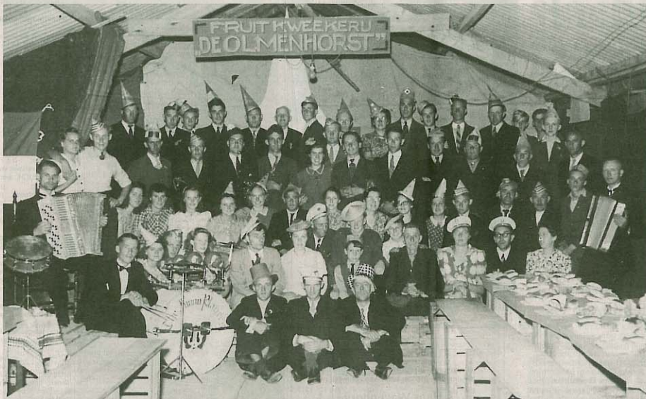
Bevrijdingsfeest op de Olmenhorst, compleet met orkest, in een van de grote schuren.

Op de Olmenhorst worden de zaken stelsel aangepakt. Via illegale telefoonlijnen en schakelingen in de centrales kan het hoofdkwartier overal vandaan