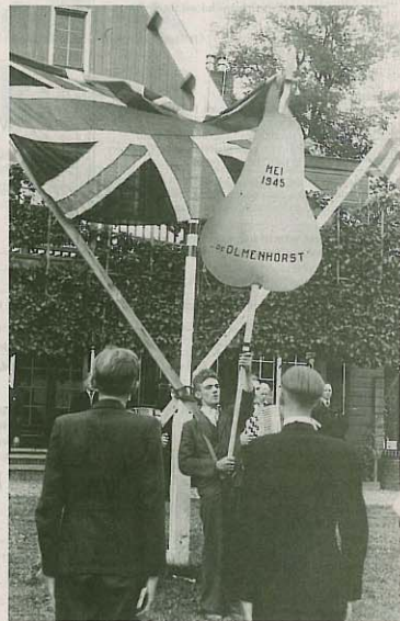
Bij het hijsen van de vlaggen bestaat het 'vaandje' van de Olmenhorst uit een houten peer.

Het wordt spannend. De Clerq wordt vastgebonden op een stoel en mag dan zijn boodschap vertellen: de officieren mogen hun wapens houden, de soldaten moeten die inleveren. „Toen zei die man: Auch wenn nur ein Meer von Blut bleibt, wir kämpfen weiter. Daarop ontstond een bevelketterij, maar