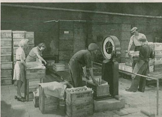
De grote fruitschuur in 1946, waar in het laatste jaar van de oorlog werd geïmporteerd met de vuurwapens.

worden gebeld, op een gegeven moment zelfs vanuit het buitenland. Tot september heeft het verzet in de Haarlemmermeerse slechts de beschikking over wat verscien pistolen en revolvers van een voormalige politiemann, maar dat verandert als de geallieerden hen gaan voorzien van wapens. Ze worden in weilanden bij Leimuiden en Alphen gedropt, want in de polder zijn te veel soldaten gelegerd en bovendien staat bij Nieuw-Vennep een groot zoektocht opgesteld.